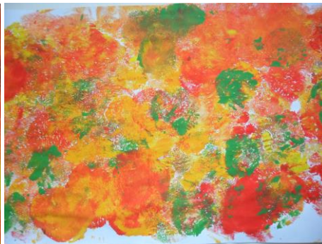
Peinture au ballon