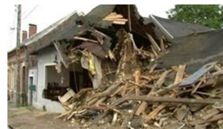
S'ÉCROULE s'écroule s'écroule