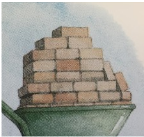
BRIQUE brique brique