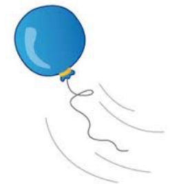
S'ENVOLE s'envole s'envole