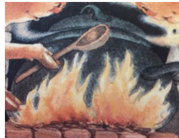
MARMITE marmite marmite