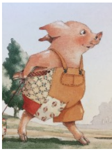
COCHON cochon cochon