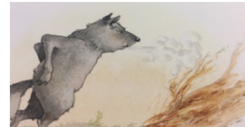
SOUFFLE souffle souffle