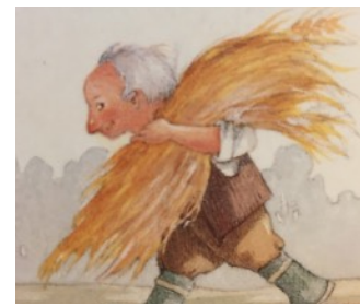
PAILLE paille paille