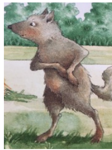
LOUP loup loup