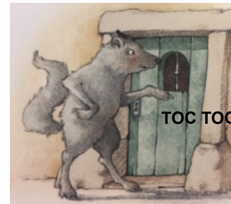
FRAPPE À LA PORTE frappe à la porte frappe à la porte