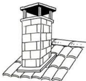
CHEMINÉE cheminée cheminée